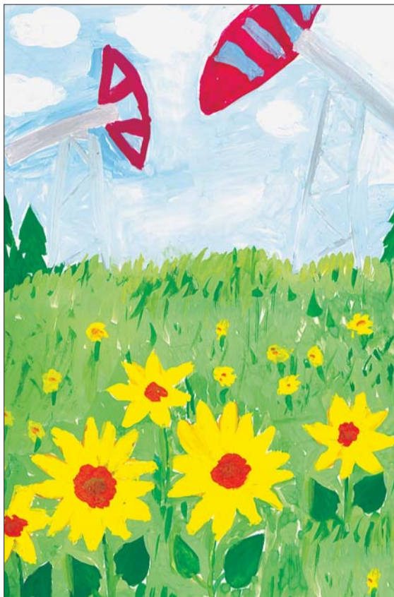
Рисунок Тагира Исламова.

Коллектив игринского детского сада № 8 «Аленушка» искренне поздравляет всех работников ОАО «Удмуртнефть», а игринских нефтяников в частности, с профессиональным праздником — Днем нефтяника!