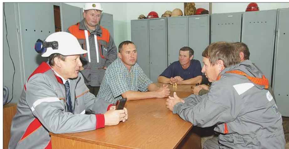
Рабочие задают вопросы напрямую.