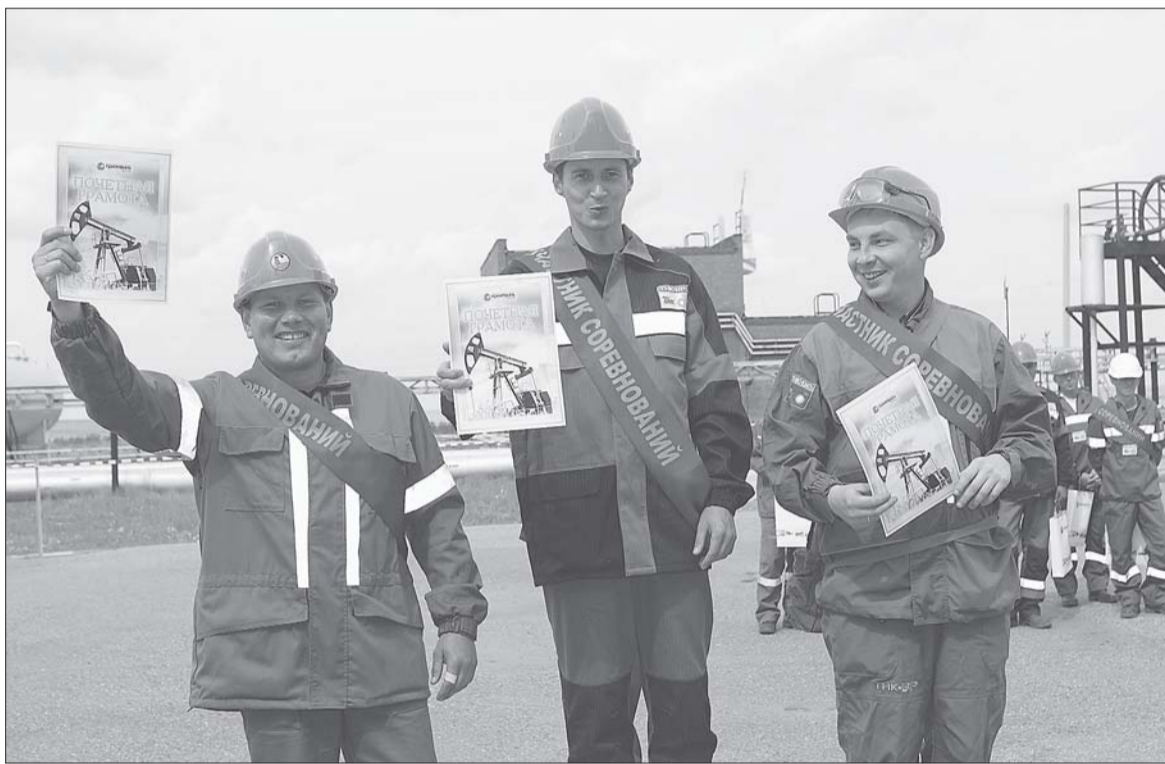
Самые-самые лучшие операторы по добыче нефти ОАО «Удмуртнефть».