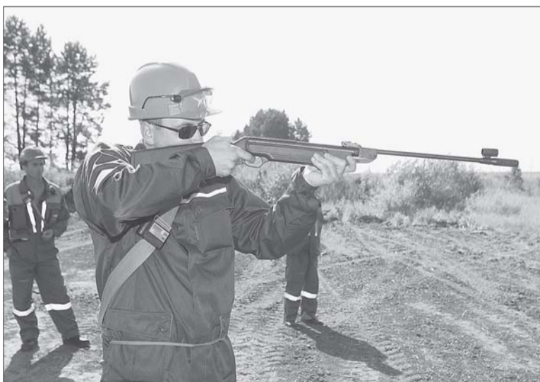
В «яблочко» попасть непросто.

нять участие в конкурсах по стрельбе из духового ружья, армрестлингу и гиревому спорту. Вся эта веселая суета помогла соревнующимся слегка расслабиться, снять напряжение перед самым ответственным этапом – практической частью, традиционно заключающейся в смене сальниковых уплотнений СУСГа.