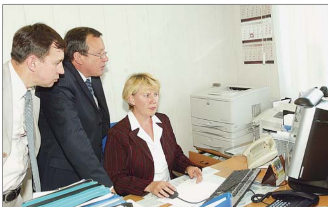
В диспетчерской НГДУ.