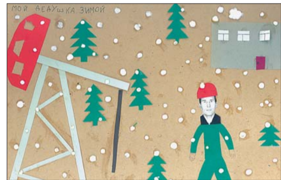
Апликация Галии Абашевой.