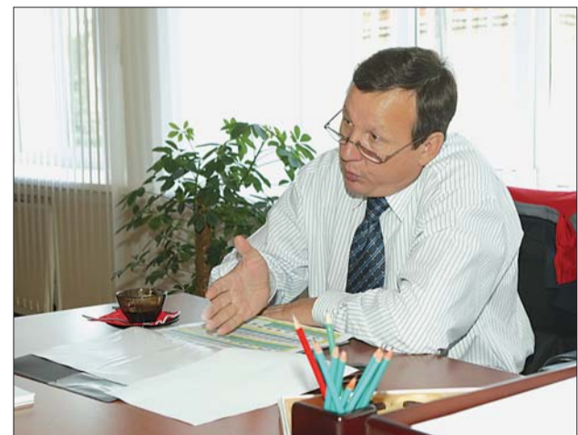
Давайте обсудим все проблемы.