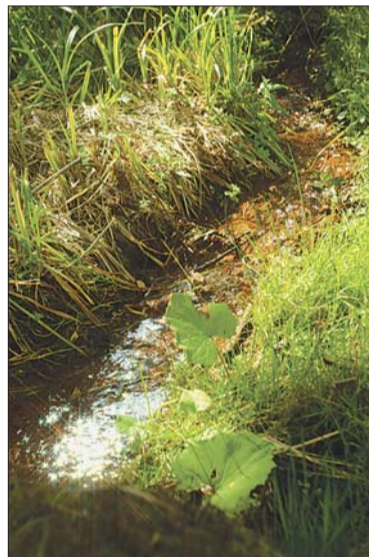
Так начинаются реки.

Действительно, здорово! И облагороженный родник, и живописный плетень, и беседка с масками-оберегами на столбах, и глиняная печь рядом, словно из сказки (в ней студенты обжигали фигурки вылепленных своими руками «идолищ» и пекли хлеб), и красочный информационный стенд с историей Ижа, полу-