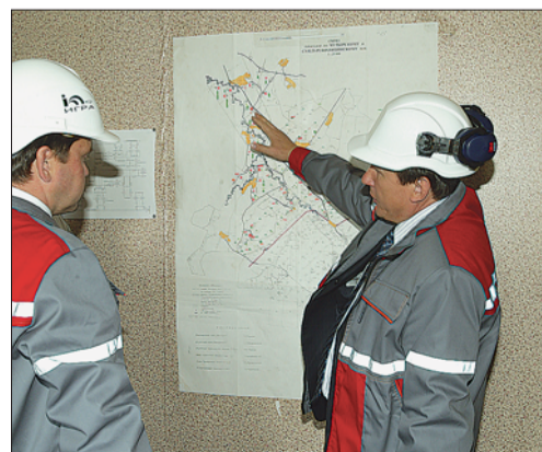
«Игра» на карте.