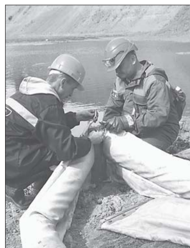
Соединяем боны, и ловушка для нефти готова.