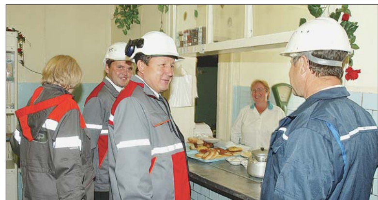
Как тут вас кормят?