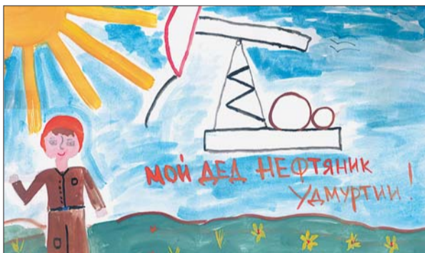
Рисунок Насти Субботиной.