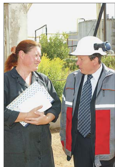
Это наше общее дело!