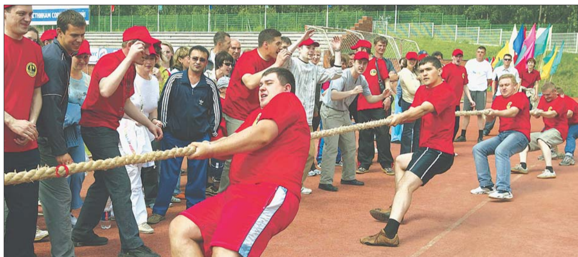
Один из жарких эпизодов Спартакиады-2006.

Первый тур Спартакиады проводился на предприятиях, где формировались команды, отбирались лучшие атлеты для участия в финальных