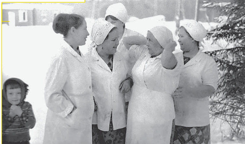
Группа поваров Игринского НГДУ. Фото 1980 г.