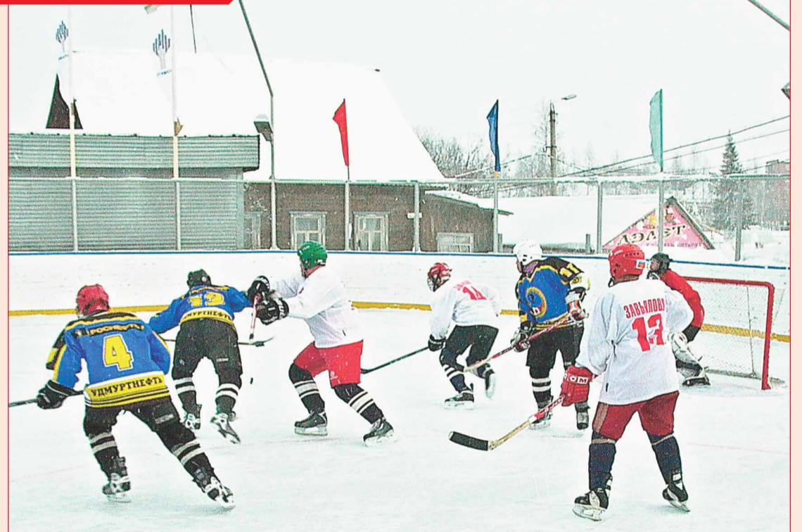
В Игре состоялся финал Удмуртской Республики среди сельских команд по хоккею.