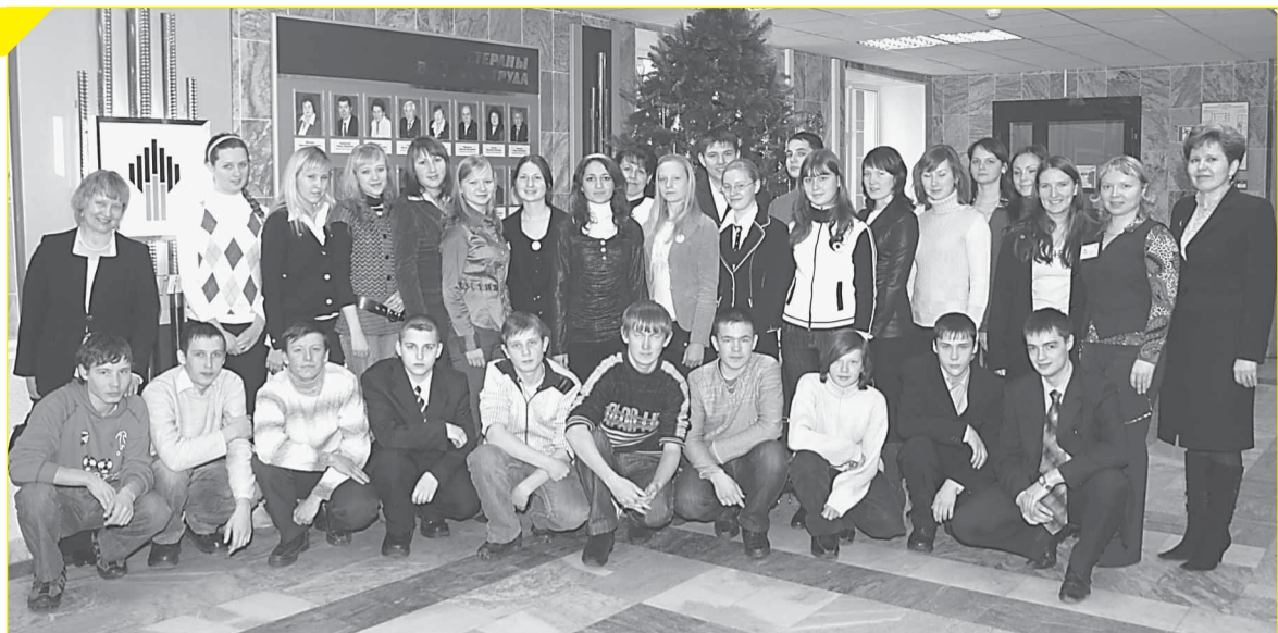
Фото на память: «Мы всем классом были в «Удмуртнефти».