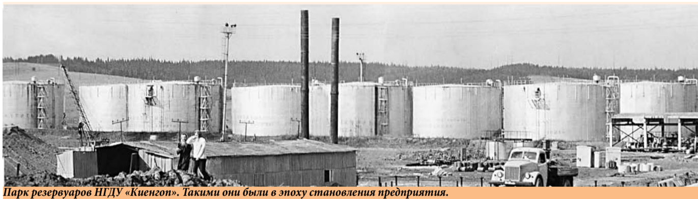
Парк резервуаров НГДУ «Киенгон». Такими они были в эпоху становления предприятия.