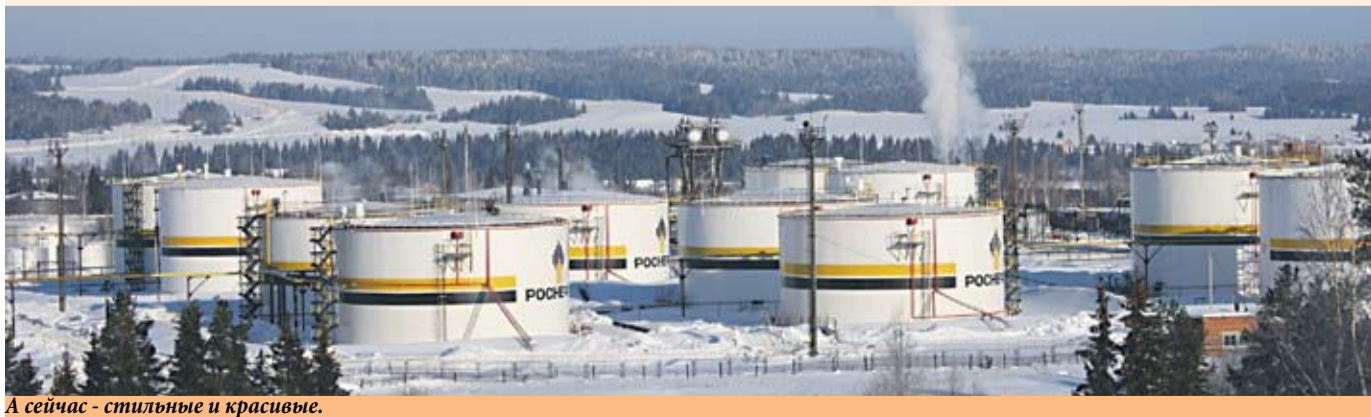
А сейчас — стильные и красивые.