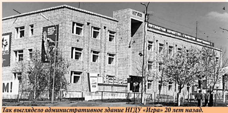
Так выглядело административное здание НГДУ «Игра» 20 лет назад.

В августе 2009-го ОАО «Удмуртнефть» исполнилось 42 года. Все это время предприятие динамично развивалось. Изменились фасады зданий, модернизировалось производство, рабочие условия для сотрудников стали комфортнее. В архиве редакции мы нашли фотографии 20-летней и 30-летней давности. Предлагаем их Вашему вниманию!