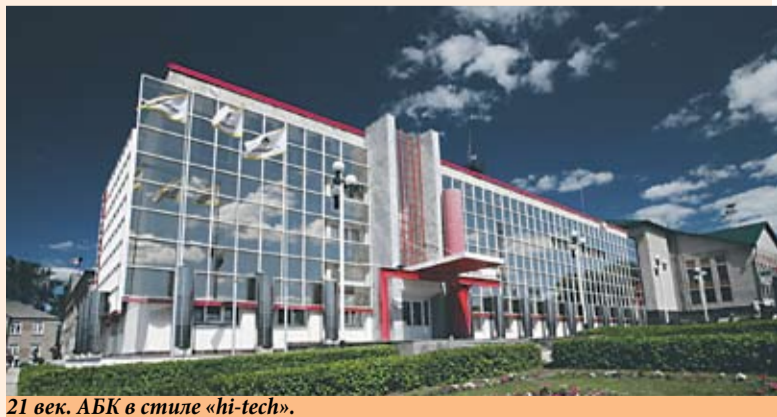
21 век. АБК в стиле «hi-tech».