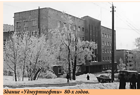
Здание «Удмуртнефти» 80-х годов.