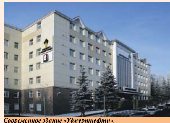
Современное здание «Удмуртнефти».