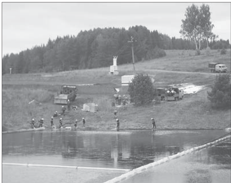
К учениям «Удмуртнефть» готовится тщательно.