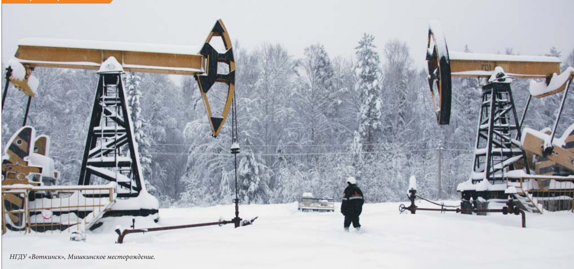
НГДУ «Воткинск», Мишкинское месторождение.