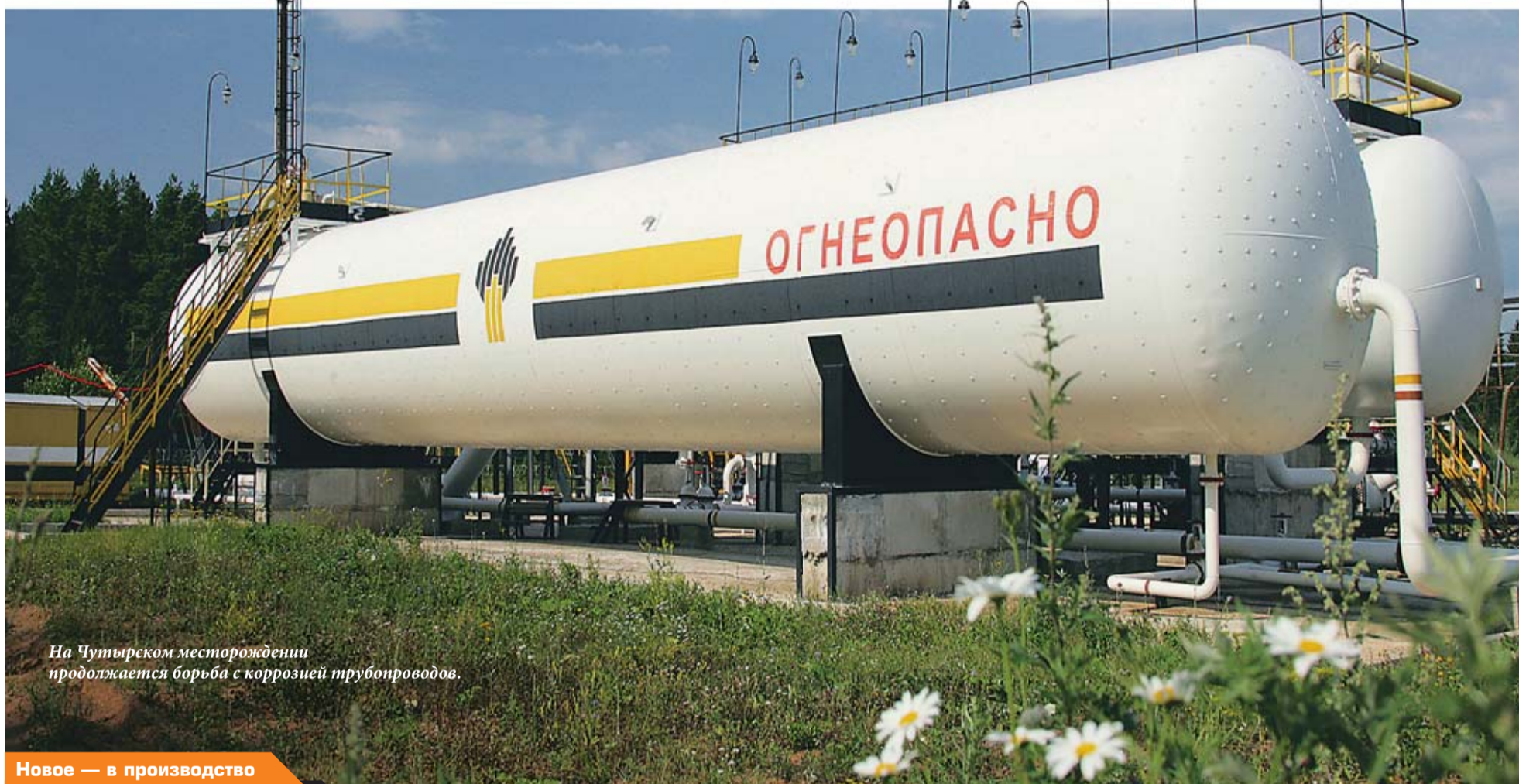
На Чутырском месторождении продолжается борьба с коррозией трубопроводов.